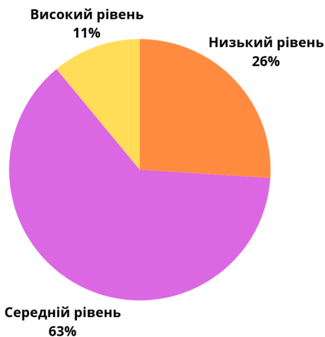
Рисунок 2.2. Показники рівнів комунікативного контролю у підлітків за методикою М. Шнайдера

Графічно результати діагностики рівнів комунікативного контролю підлітків за методикою М. Шнайдера подано на рисунку 2.2.