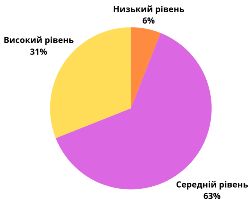
Рисунок 2.5. Показники рівня впевненості, рішучості та опори на власні сили підлітків за опитувальником «Діагностика рівня асертивності»

Графічно результати за показниками рівня впевненості, рішучості та опори на власні сили за шкалою Б подано на рисунку 2.5.