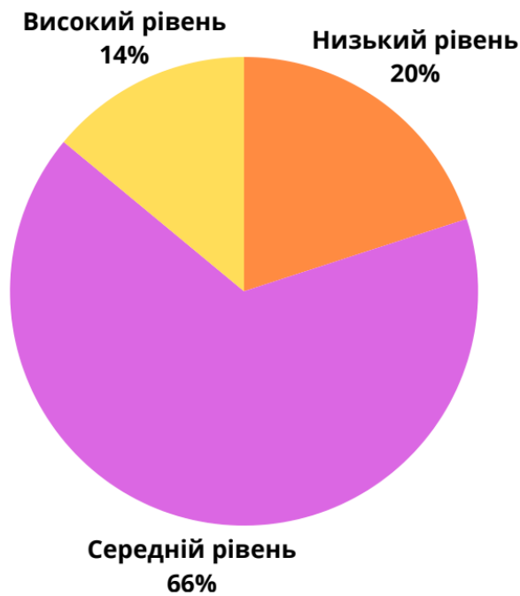
Рисунок 2.1. Показники рівнів емпатії у підлітків за тест-опитувальником А. Мехрабіана та Н. Епштейна

Підсумовуючи результати даної методики, можна зробити висновок, що більшість підлітків мають середній рівень емпатійності, що свідчить про наявність базової здатності до співпереживання та розуміння емоцій інших людей. Водночас значна частка досліджуваних демонструє низький рівень емпатії, що може ускладнювати ефективну взаємодію у міжособистісних відносинах.