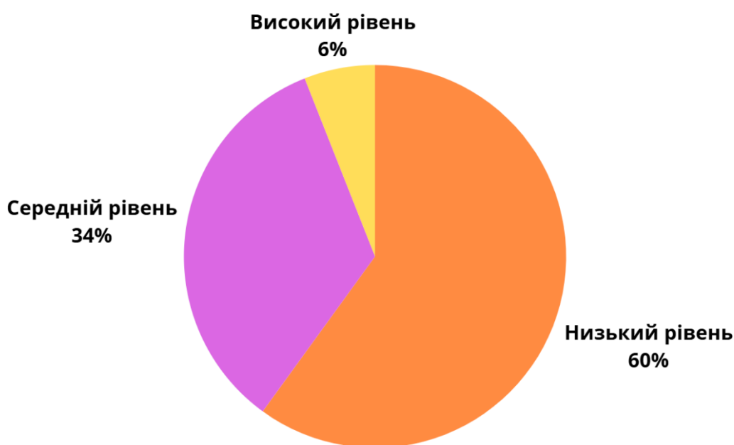
Рисунок 2.3. Показники рівнів компетентності у вирішенні конфліктів підлітків за тест-опитувальником П.П. Хеппнера та І.Х. Петерсена

Графічно результати діагностики рівнів компетентності підлітків у вирішенні конфліктів за тест-опитувальником П.П. Хеппнера та І.Х. Петерсена подано на рисунку 2.3.